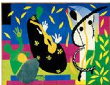
Tristesse du Roi 1952